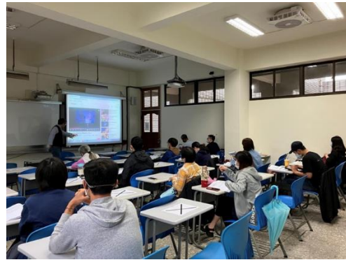
說明：榮老師以穹頂之下這部紀錄片做為課程開頭