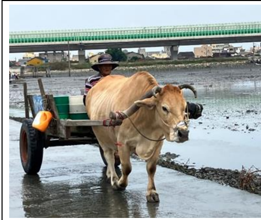
說明：大城濕地特有的海牛文化