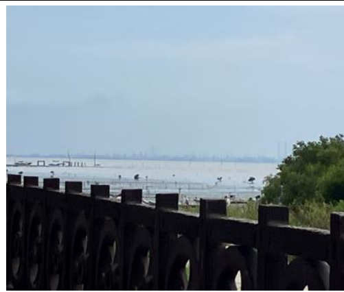
說明：濕地及工業區(環境及經濟)對比