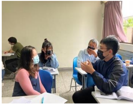
說明：學生和同組組員分享自身與自然環境互動之經驗