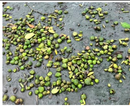
說明：危害當地物種的「外來」海茄冬種子