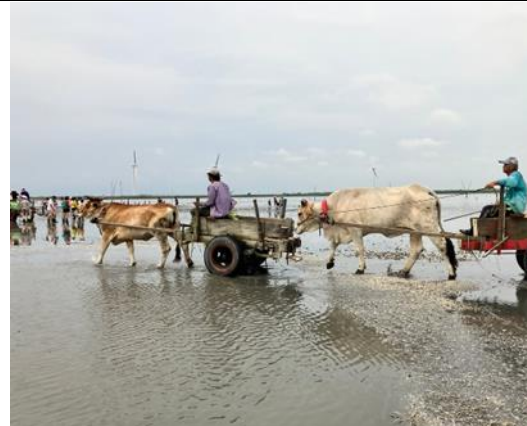
說明：自養蚵業轉型為生態觀光的海牛車隊