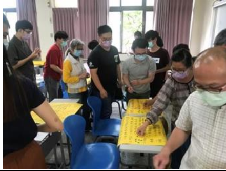
說明：於環境教育教材教法教案設計小活動中，學生們為喜歡的教案投票