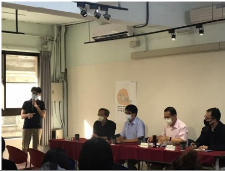
鄉村地區整體規劃座談會