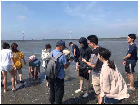
校外參訪體驗-濕地生態探索