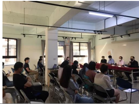
鄉村地區整體規劃座談會