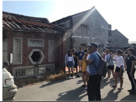
校外參訪體驗-社區導覽