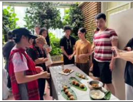
第一組「尋巡」之西力克鳥飯糰／評審及來賓品嚐