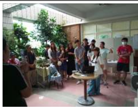
第三組以「菌子好」之菌-蛋-土-菌循環型農業概念食物設計／設計理念發表