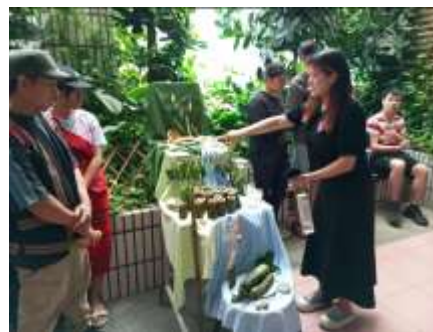
第二組「Atayal Kulutlaka」之泰雅族三層冰箱／設計理念發表