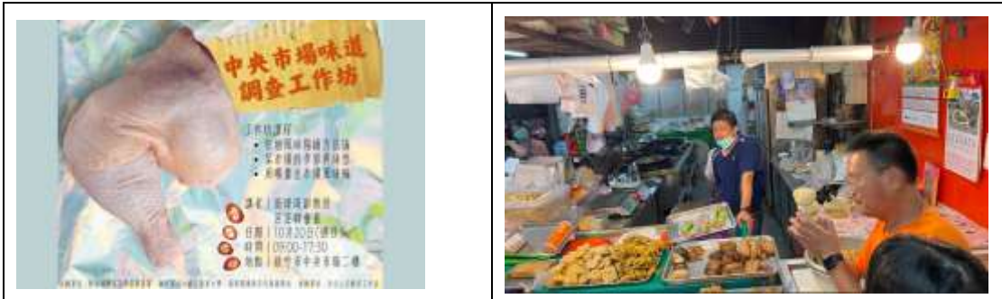
2024/10/20 中央市場味道調查工作坊／前店後廠導覽解說