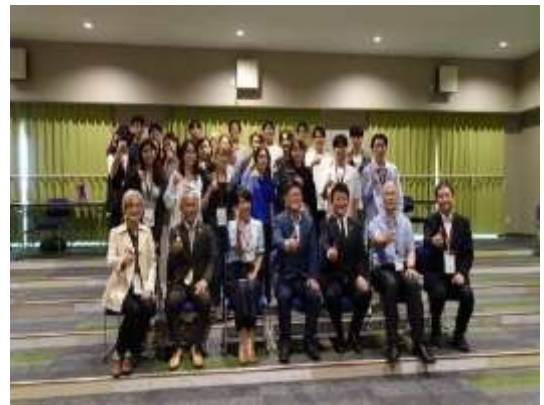
Day Three- Monday 24 th June 2024