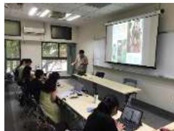
2024/10/16 菜市場裡的味道論壇海報／兩位主講人分享