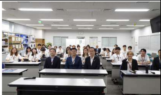
Day Five- Wednesday 26 th June 2024