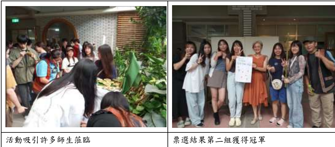
活動吸引許多師生蒞臨