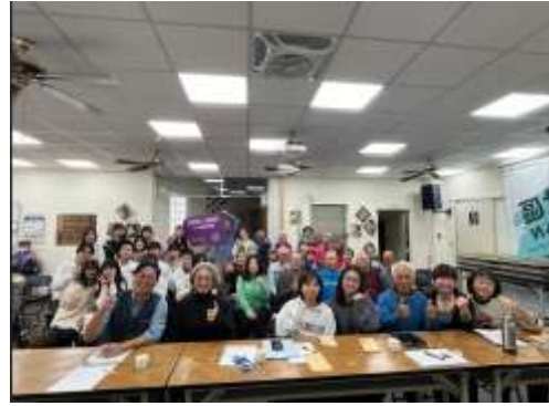
2024/12/20 成果發表會大合照