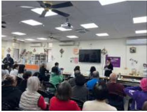
評審(社區發展協會執行長)講評