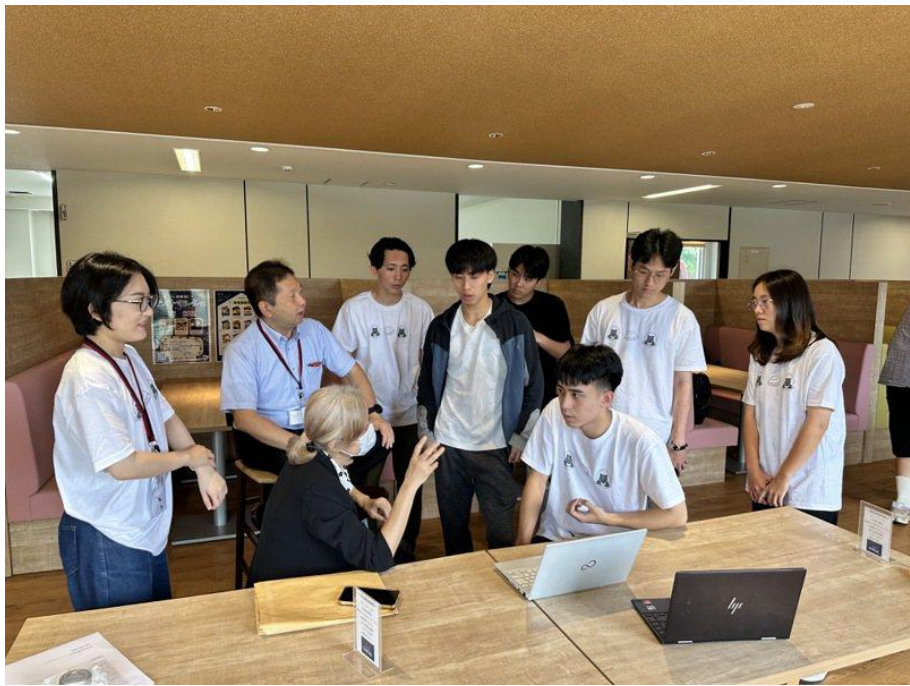
說明：台日跨國創造富士市的SDGs共想討論