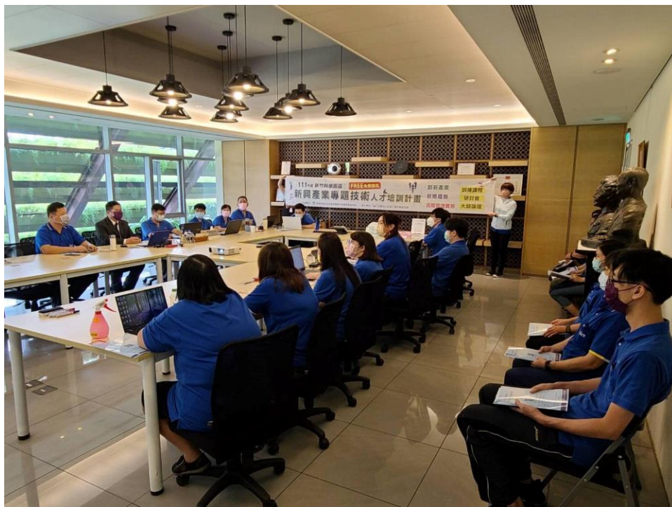
桃園科學園區：碳治理，演講，龍潭廠訓