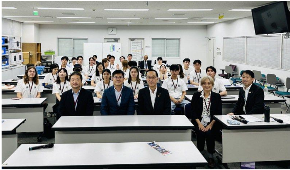
說明：舉富士市市長合照