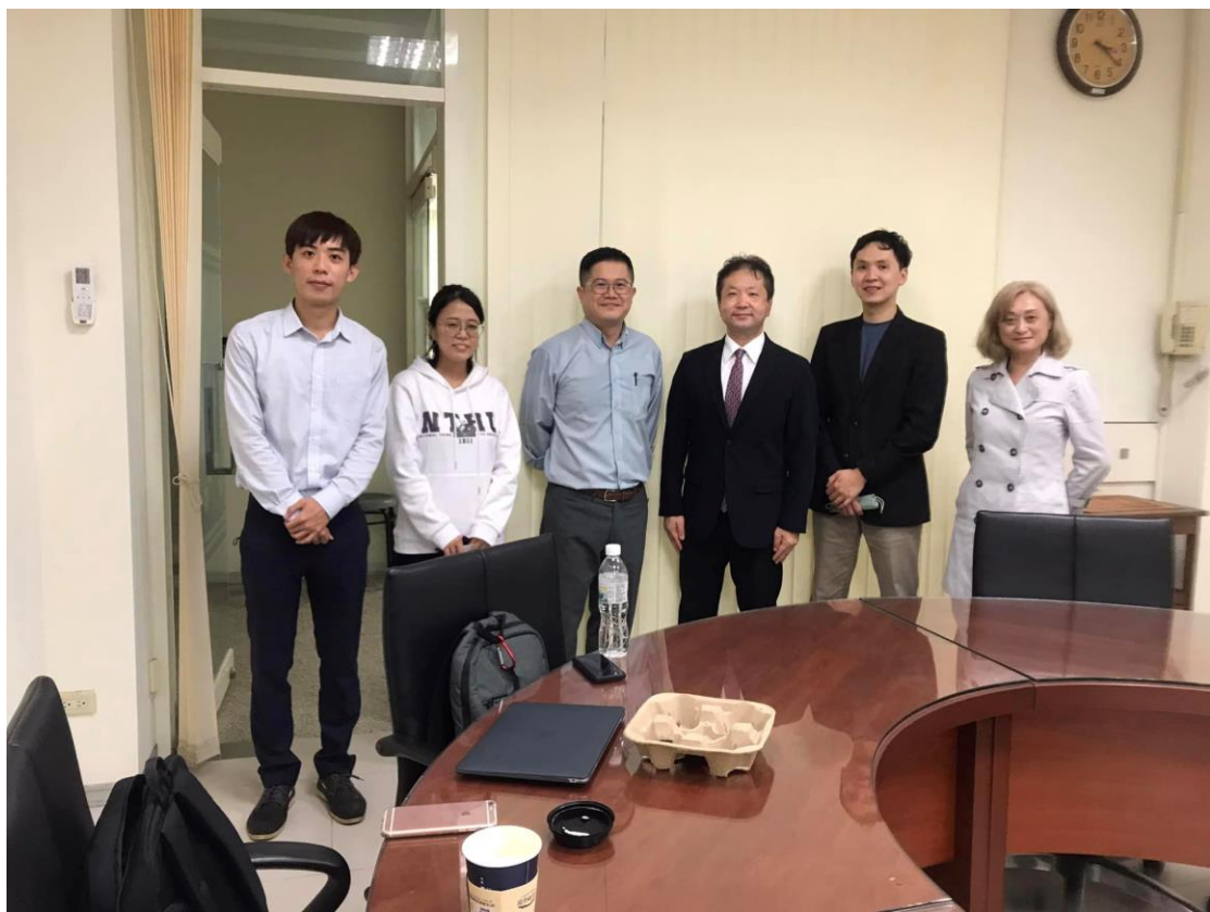
早稻田大學雙碩士學位契約起草