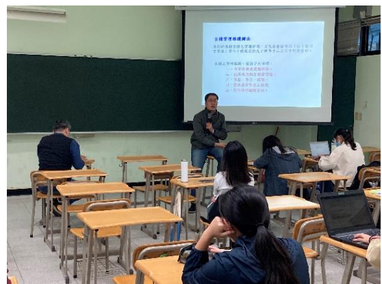
說明：「文化資產管理維護的困境蛻變與展望」演講照片