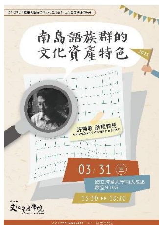
說明：「南島語族群的文化資產特色」演講海報