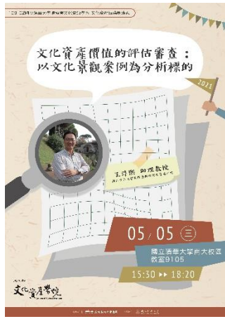
說明：「文化資產價值的評估審查：以文化景觀案例為分析標的」演講海報