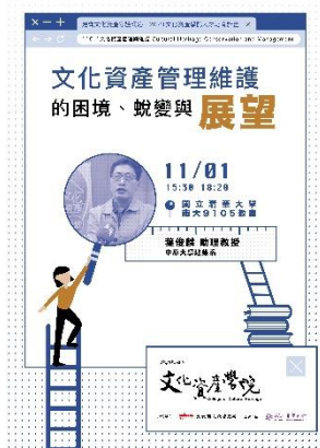
說明：「文化資產管理維護的困境蛻變與展望」演講海報