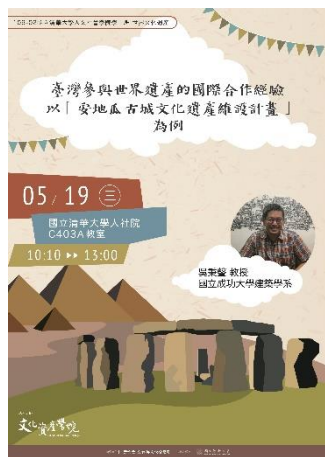
說明：「臺灣參與世界遺產的國際合作經驗—以「安地瓜古城文化遺產維護計畫」為例」演講海報