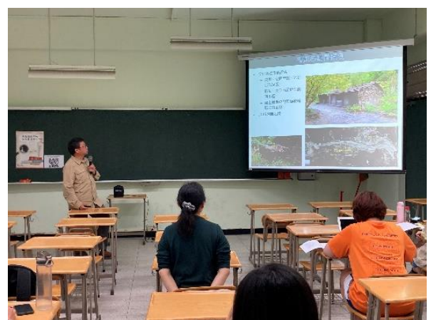
說明：「南島語族群的文化資產特色」演講照片