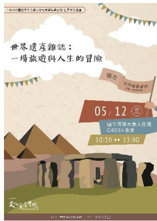
說明：「世界遺產雜誌：一場旅遊與人生的冒險」演講海報