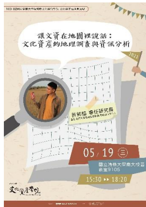
說明：「讓文資在地圖裡說話：文化資產的地理調查與資訊分析」演講海報