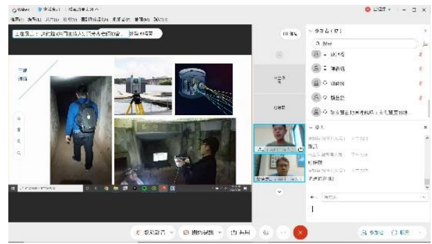
說明：「讓文資在地圖裡說話：文化資產的地理調查與資訊分析」演講照片