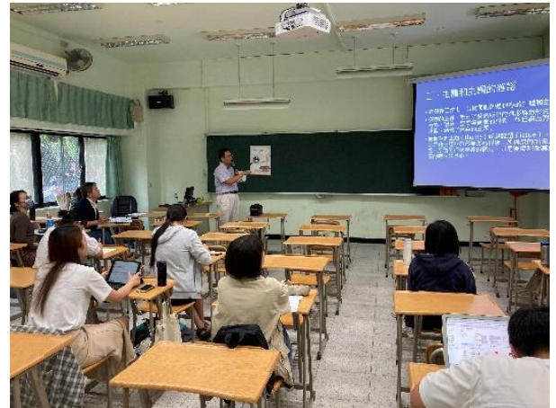
說明：「文化資產價值的評估審查：以文化景觀案例為分析標的」演講照片