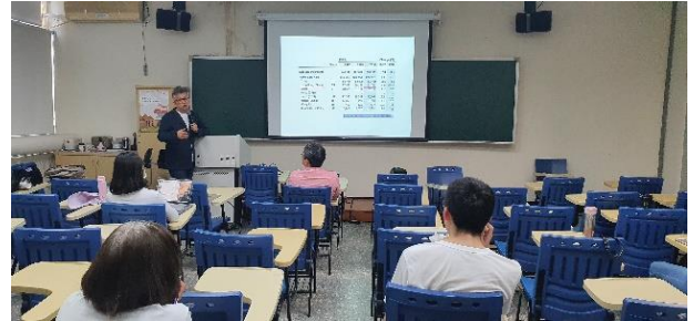
說明：「世界遺產雜誌：一場旅遊與人生的冒險」演講照片