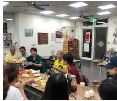
10/23 學生分組訪談社區了解社會需求