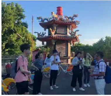
9/25 由地方專家帶學生走讀香山社區