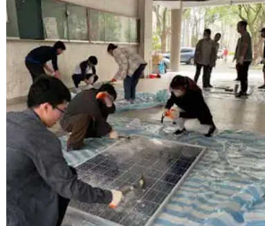
5/23 帶學生拆解太陽能板，思考能源 議題