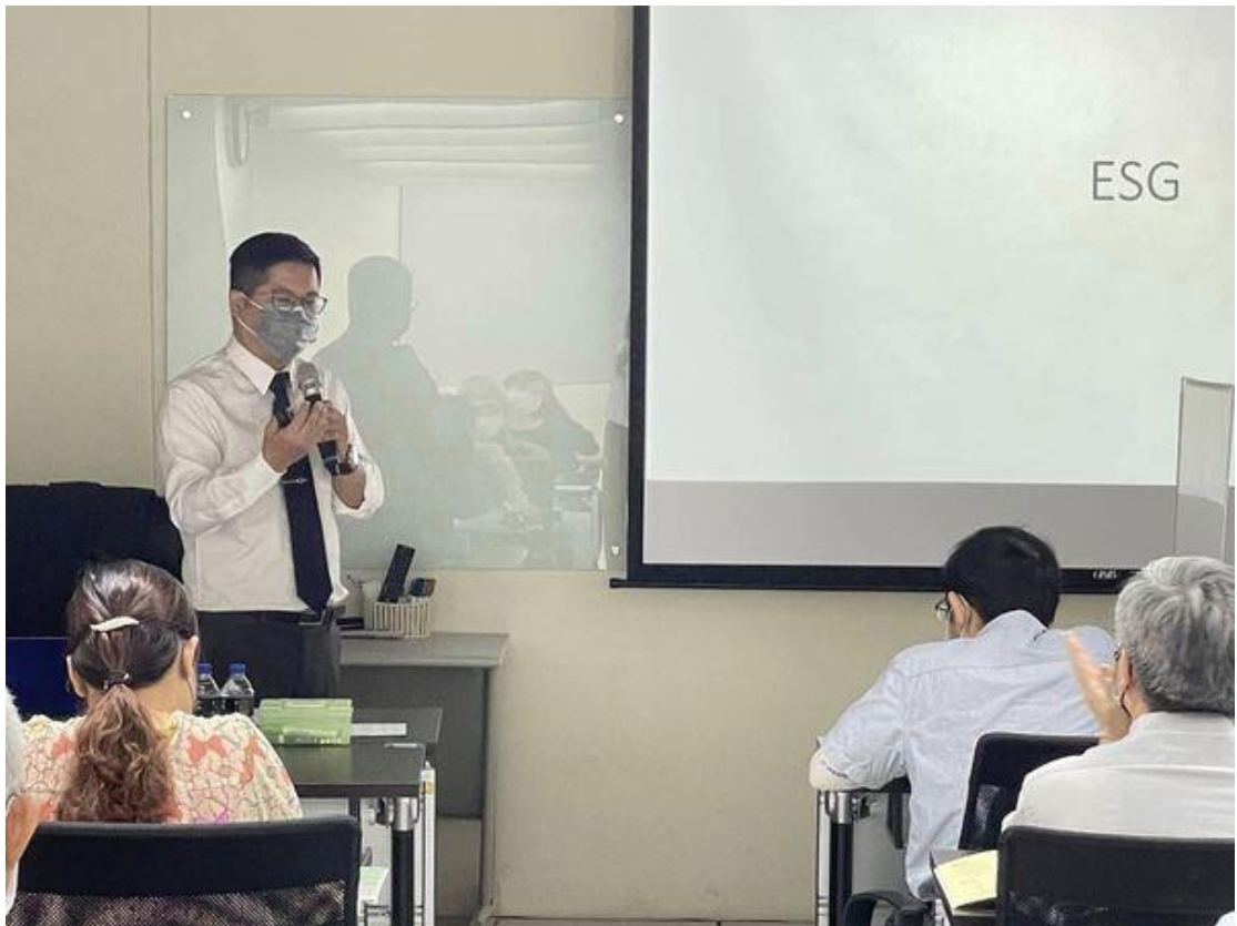
執行【竹科管理局免費課程】-- ESG 之解構與建構及企業永續發展。