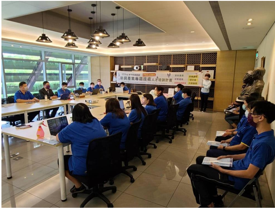
桃園科學園區：碳治理，演講，龍潭廠訓