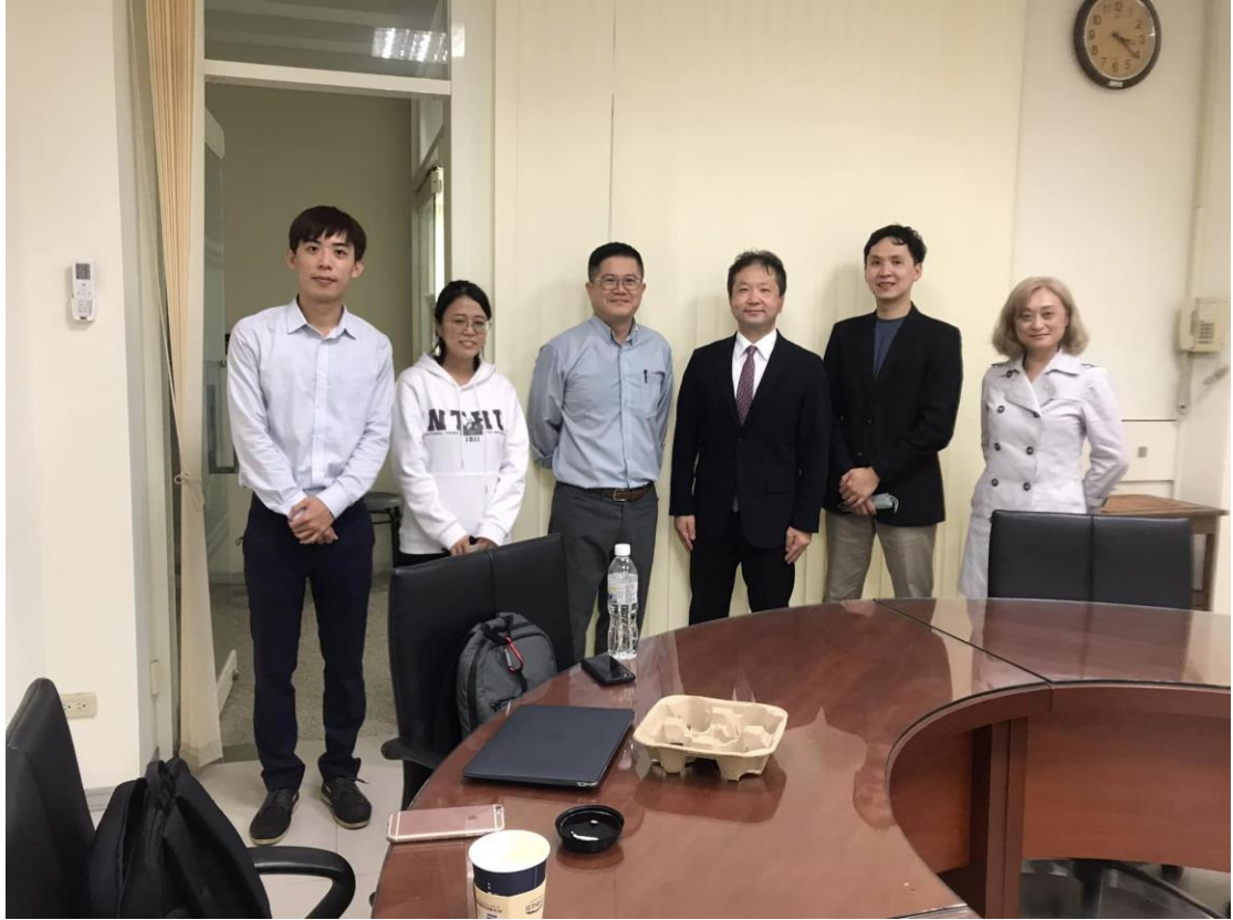
早稻田大學雙碩士學位契約起草