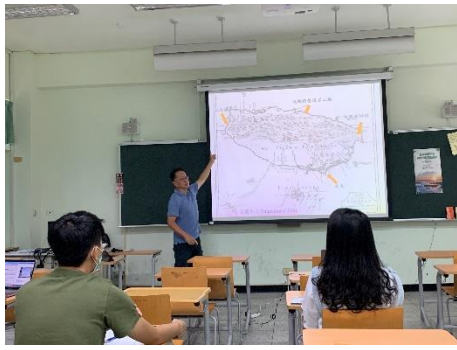
說明:環境教育講座