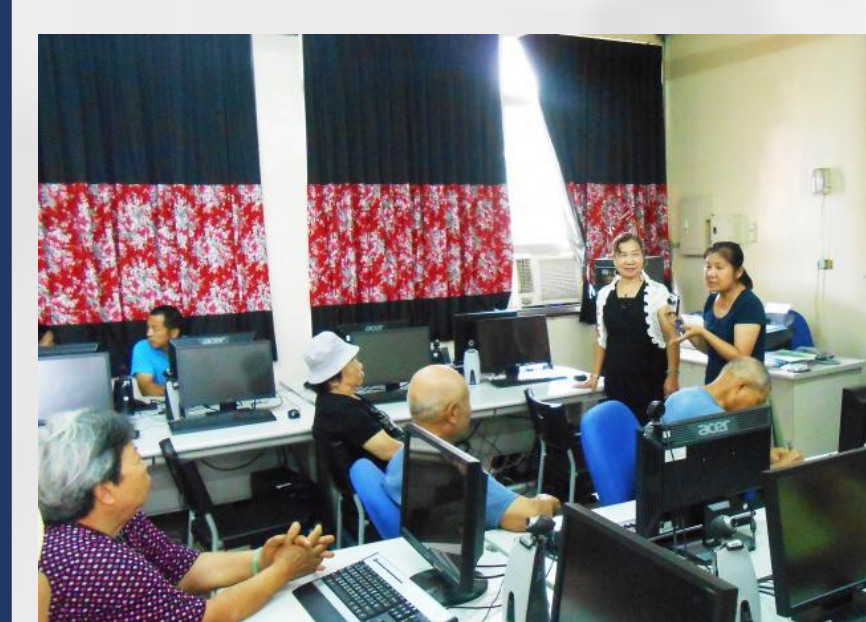
橫山數位機會中心