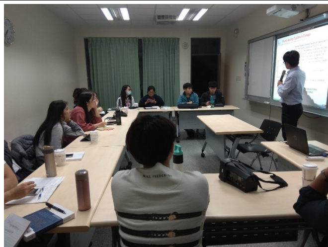
圖 4 講座畫面。