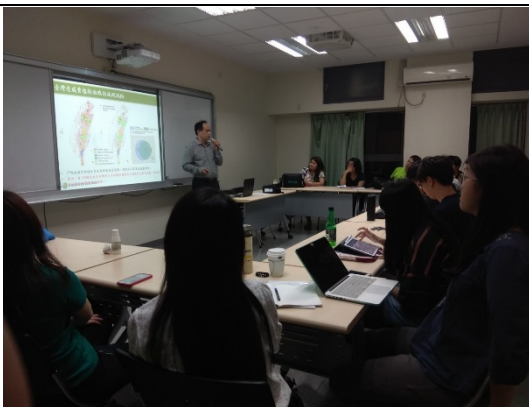
圖 4 講座畫面。