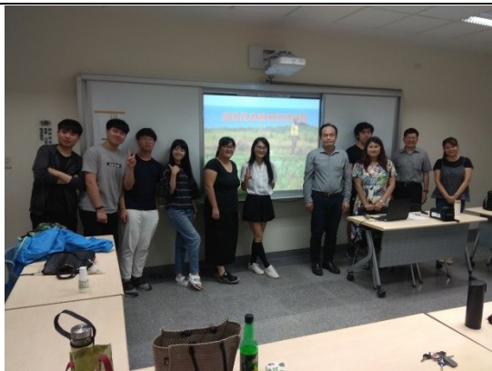
圖 5 講者與聽講學生合照。