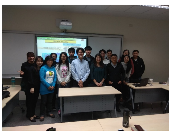
圖六 講者與聽講學生合照。