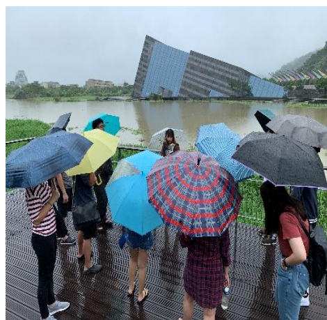
圖 2 「戶外活動與解說」課程校外教學全英文進行，風雨中解說蘭陽博物館