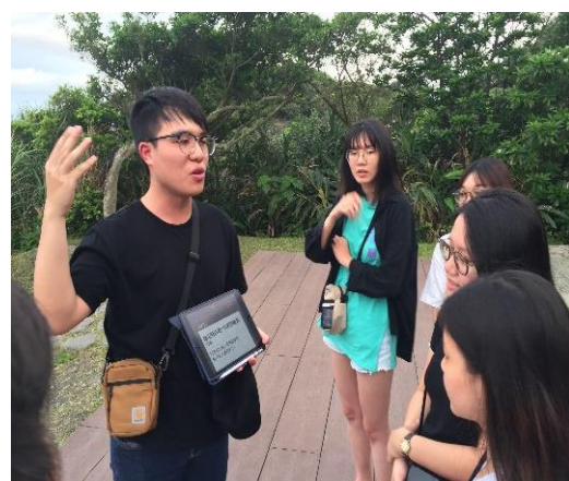
圖 1 「戶外活動與解說」課程校外教學全英文進行，解說宜蘭北關海岸